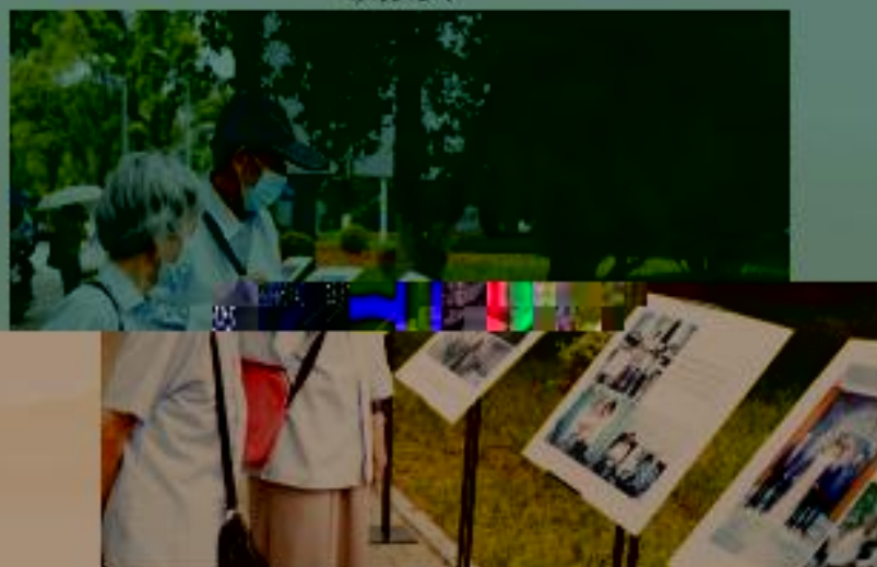
老同志追忆研究院国际合作历史