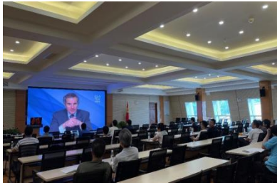
上 FEC 2020