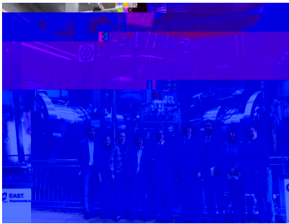
JST 京事 - ( 5 ) - EAST

4 ) K (EAST) (SHMFF) K (JST Japan Science and Technolog ) (SICORP) ) K